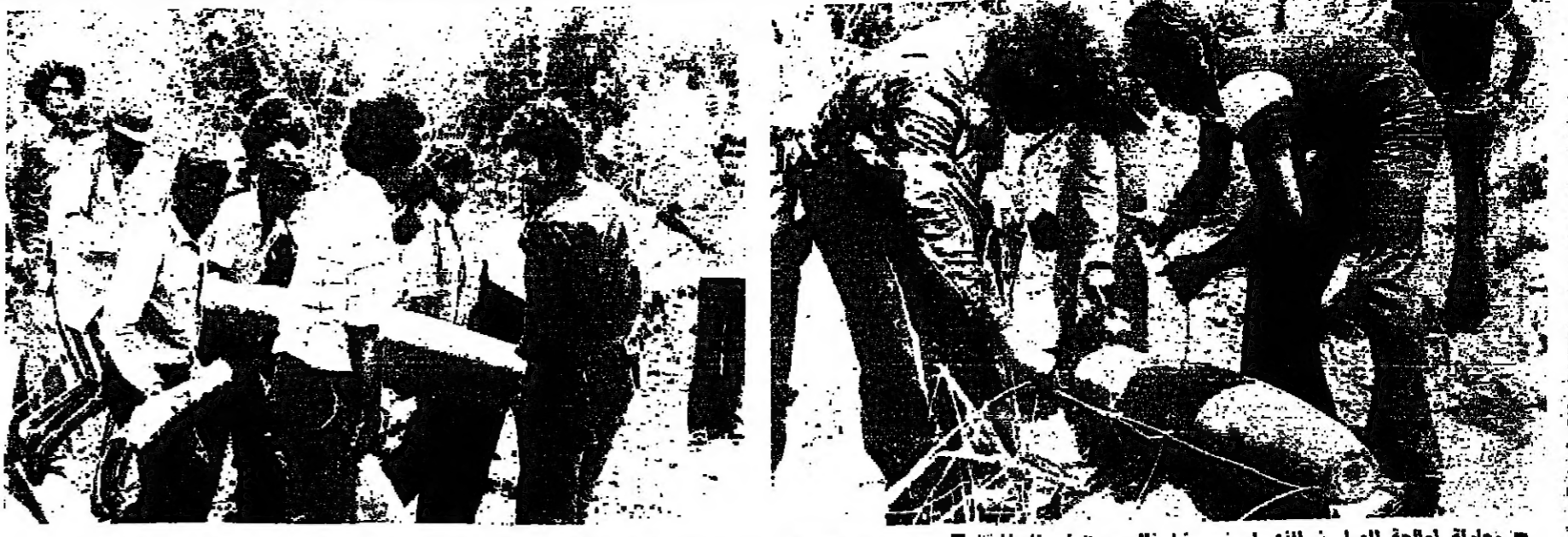
محاولة لمعالجة الصاروخ الذي لم ينجح في نقله من المخيم البرغلية شباب من « مخيم البرغلية » يتفحصون الصاروخ الى خارج المخيم لتسليمه الى الضم العسكري

زحلة - من براسل « الاوار » : تظاهر امس حوالي ١٥٠ شخصا ، معظمهم من النساء والاطفال من بلدة بعلبك في قطع الطريق على سيارات المياه الحضرية ، ودواب الحظاء ، لعدة ثلث ساعات ، احتجاجا على عدم ابرام مياه الشفة الى بلدتهم . وعلى الاثر اجريت اتصالات سريعة بالمسؤولين ، حيث تم ابرام المياه الى البلدة ، وعاد المظاهرون الى منازلهم دون ان يحصل ما يخل بالامن .